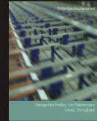
完整的型材传送系统