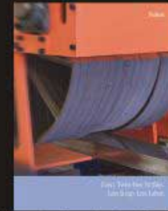
单轨双头带飞锯牵引机, 双轨双头不带飞锯牵引机, 双轨双头带飞锯牵引机和单头牵引机