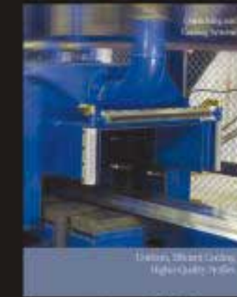
用于型材的水淬和风淬系统