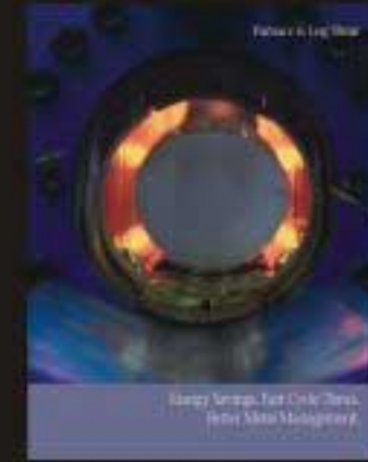
可以包括热剪的铝棒加热炉

自1947年创立以来, 格兰克 (GRANCO CLARK) 一直是北美铝挤压行业最重要的设备供应商。我们拥有最先进的一体化挤压系统, 我们的设备包括: